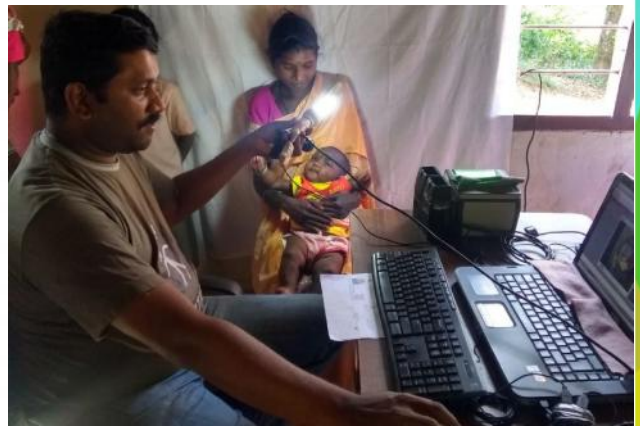
പാലക്കാട്: അട്ടപ്പാടിയിൽ ആധാർ എൻറോൾമെന്റ്