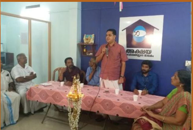
കണ്ണൂർ: KNR182 - അക്ഷയ കേന്ദ്രം ശ്രീ. എ.എൻ. ഷംസീർ എം.എൽ.എ ഉദ്ഘാടനം ചെയ്യുന്നു.

കൃത്യത, വ്യക്തത, സമയനിഷ്ഠ, സത്യസന്ധത, ചിരിക്കുന്ന മുഖം - ഇത്രയുമുണ്ടെങ്കിൽ ഒരിക്കൽ വന്നവർ വീണ്ടും നമ്മുടെ സെന്ററിലേക്ക് വരും. ആദ്യം നേടിയെടുക്കേണ്ടത് ജനങ്ങളുടെ വിശ്വാസമാണ്. അതു നേടിക്കഴിഞ്ഞാൽ വിജയം സുനിശ്ചിതം.