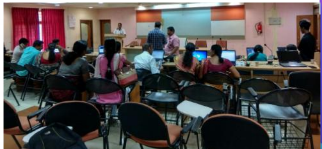
കാസർഗോഡ് : കിയോസ്ക് ബാങ്കിംഗ് പരിശീലനം

ജില്ലാതലത്തിൽ നടക്കുന്ന പരിപാടികളുടെ ഫോട്ടോയും റിപ്പോർട്ടും newsletteraspo@gmail.com എന്ന മെയിലിലേക്ക് അയച്ചു തരേണ്ടതാണ്.