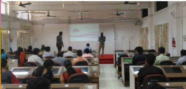
ഇടുക്കി : ഐസിടി അക്കാദമിയുടെ പരിശീലനം