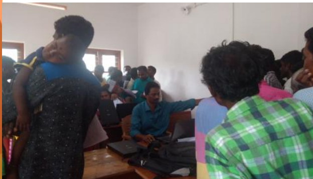
കണ്ണൂർ: പേരാവൂർ എസ്സി/എസ്ടി ആധാർ എൻറോൾമെന്റ്