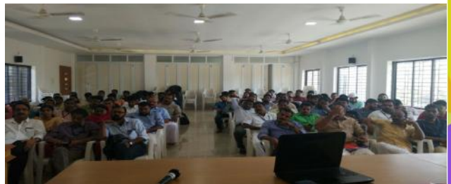
മലപ്പുറം : കിയോസ്ക് ബാങ്കിംഗ് പരിശീലനം