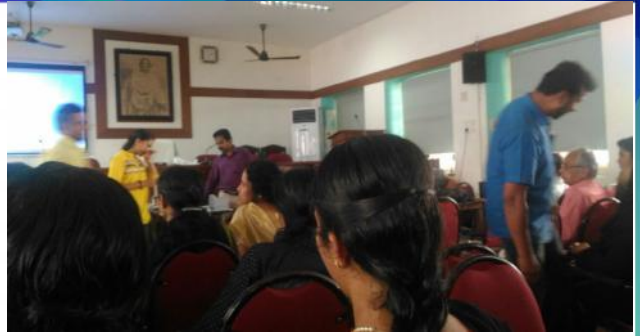
കോട്ടയം : ആധാർ ഓപ്പറേറ്റർമാർക്ക് പരിശീലനം

ന്യൂസ് ലെറ്ററിൽ ഉൾപ്പെടുത്തുന്നതിലേക്ക് ജില്ലാതലത്തിൽ നടക്കുന്ന പരിപാടികളുടെ റിപ്പോർട്ടും ഫോട്ടോയും newsletteraspo@gmail.com എന്ന മെയിൽ ഐഡിയിലേക്ക് അയച്ചു തരേണ്ടതാണ്.